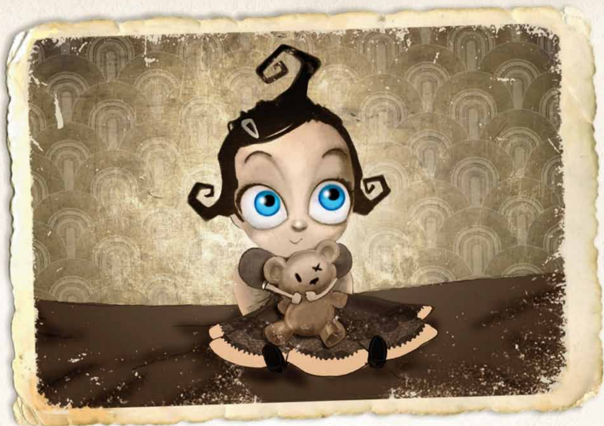
Carmesina a los 6 meses

Por eso, Carmesina, nada más nacer, fue un ápice de esperanza para sus padres y un caso curioso, pues era la primera niña en muchos años que nacía con los ojos azules en lugar de la mirada oscura del resto de infantes.